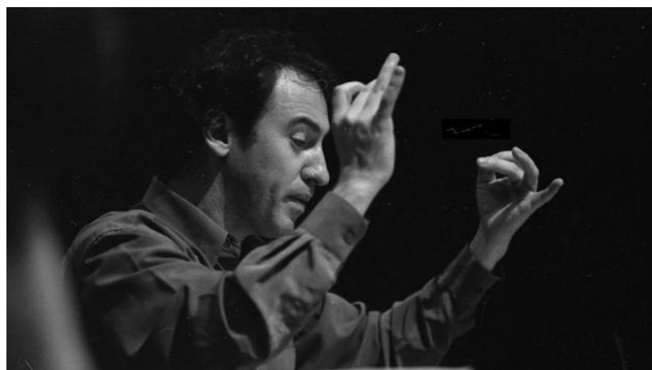
El compositor Fabián Panisello